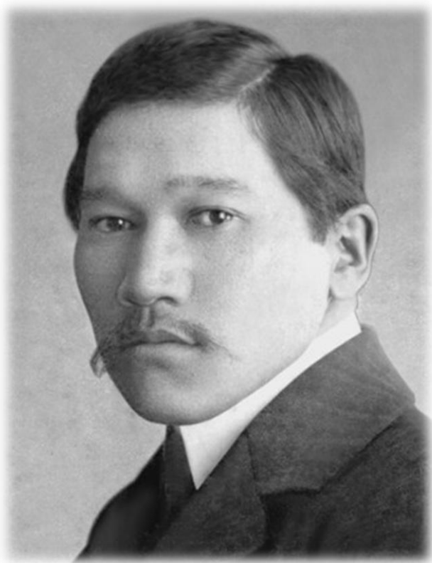
Мыржакып Дулатов (1885 – 1935)